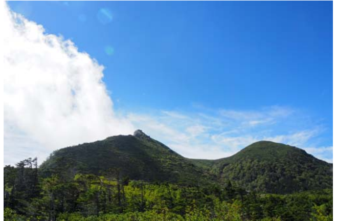
〈東天狗岳山頂から赤岳〉