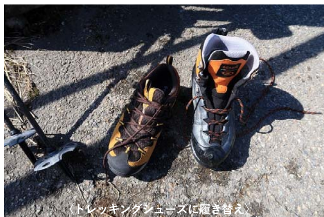
〈トレッキングシューズに履き替え〉