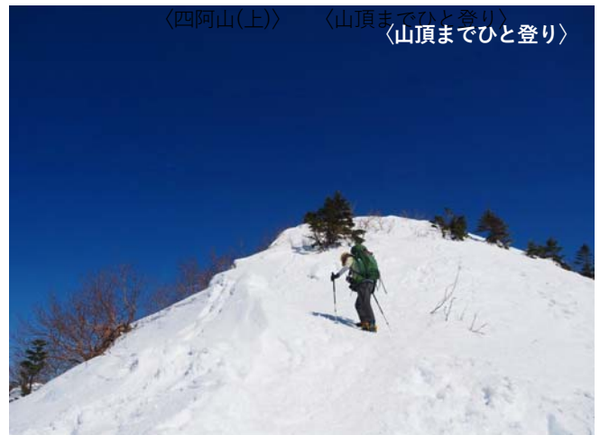
〈四阿山(上)〉 〈山頂までひと登り〉 〈山頂までひと登り〉