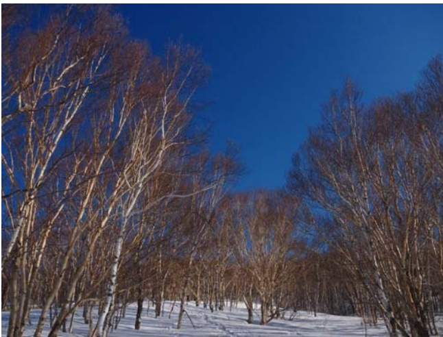
〈青空に映える白樺とカンバの林〉

日差しが強いのですぐに暑くなる。しばらく牧場を進み、白樺とカンバの林に入る。青空に映える。