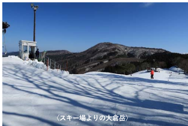
〈スキー場より的大倉岳〉