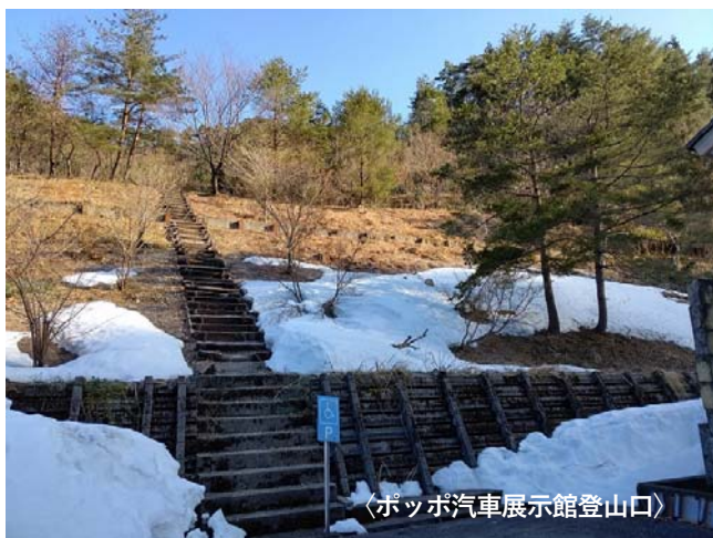
〈ポップオ自動車展示館登山口〉

県境を越えない所でストレス発散、リフレッシュ。 若い頃スキーでは行ったが頂上まで行ってなかった大倉岳へ。今日は気温が上がる予報、朝から薄着でスタートするがやはり暑い、途中で一枚脱ぐ。