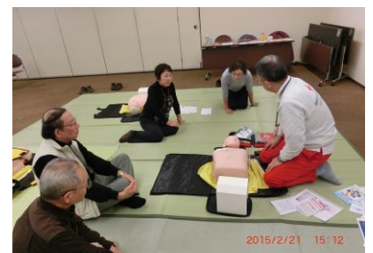
平成27年度の講習会風景