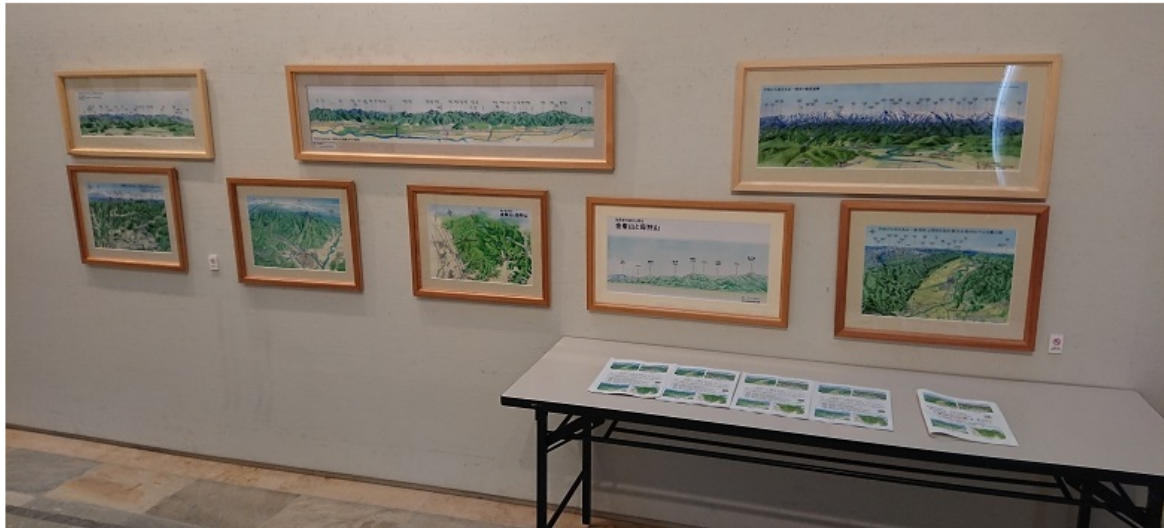
「学校から見える山」額装イラスト（2016～2019年度）の展示（2020年2月16日：酒田市美術館での展示）