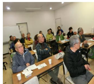
スペイン巡礼に耳を傾け