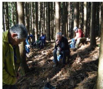
三峰ルートでの昼食