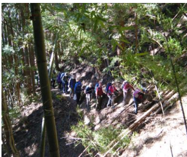
荒れ気味な登山道