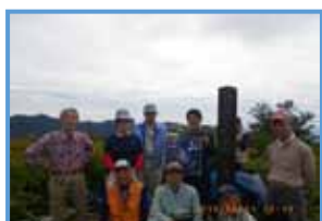
馬場目岳山頂の標柱の前で

整備された登山道ではあるが、太平洋山奥岳への歩道とは違い、利用者が少なく定期的に刈り払いが必要と思われる。