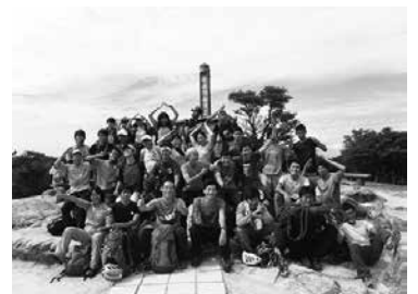
ゴザフェス集合写真