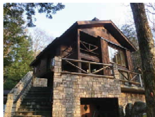
上高地山岳研究所

設備／総落差 52m 管路長 約470m (直径75mmパイプ) タービン出力 1.4KW 発電機出力 1.0KW バッテリー容量 24V 200Ah インバータ出力 AC100V 2000W